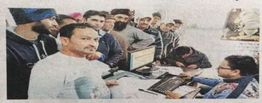
पठानकोट नगर निगम में प्रॉपर्टी टैक्स जमा करवाने वालों का लगा तांता 🛎 जागरण

नगर निगम पठानकोट में प्रॉपर्टी टैक्स जमा करवाने की अंतिम तिथि समाप्त हो गई है। अंतिम तिथि के समाप्त होने की सूचना मिलते ही सोमवार को प्रॉपर्टी टैक्स जमा करवाने वालों का तांता लगा रहा। इसके तहत सोमवार के दिन निगम में 8 लाख रुपये की वस्ली हुई। ज्ञात हो कि बीते वर्ष 2016-17 में निगम का बजट 2 करोड़ 73 लाख रुपये था इनमें से 31 मार्च 2017 तक 92 प्रतिशत प्रॉपर्टी टैक्स वसुल किया गया। इसका मुख्य कारण नोटबंदी को भी माना गया। इस वर्ष जैसे ही जीएसटी का बोलबाला हुआ तो लोगों ने प्रॉपर्टी टैक्स जमा करवाने के मामले में हाथ पीछे खींचना शुरू कर दिया यहीं कारण रहा कि पूरे वर्ष में 14 जनवरी 2018 तक निगम 5 करोड़ में से 1 करोड़ 83 लाख रुपये ही वसूल कर पाया है।