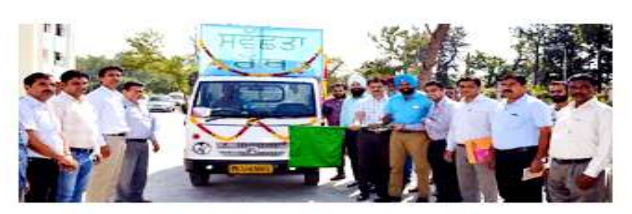
जांगरण संवाददाता, पठानकोट जिले को साफ सुधरा तथा स्वच्छता ही सेवा एक्शन प्लान के तहत जिला